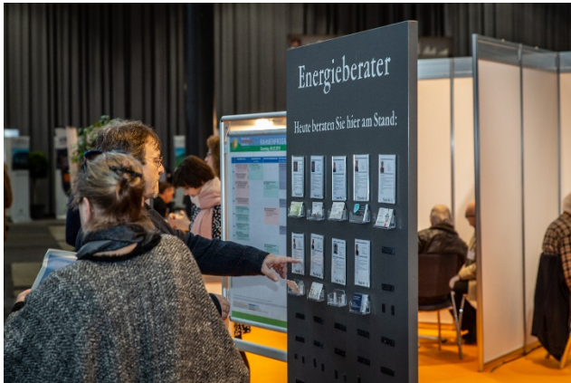
Messebesucher erhalten Impulsberatung am Marktplatz Energieberatung auf der GETEC