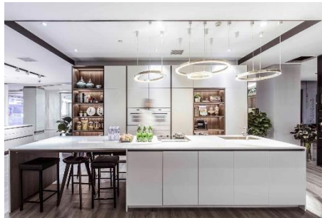
REHAU_Küchenfronten aus dem Lacklaminat RAUVISIO fino