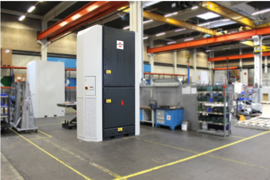
Bild 4: Der für Hallen konzipierte AmbiTower scheidet Partikel ab, die trotz einer Objektabsaugung in die Hallenluft entweichen konnten. Gleichzeitig filtert er Feinstäube, Viren, Bakterien, Sporen, Pollen und Pilze heraus. Nicht nur in Corona-Zeiten kommt das der Gesundheit der Beschäftigten sehr zugute.