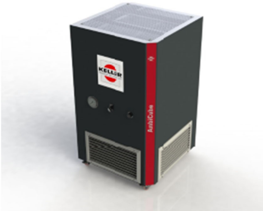
Bild 2: Der AmbiCube ist ein kompakter, flexibel einsetzbarer Raumlufreiniger. Er ist mit zwei Schwebstoff-Filterstufen ausgestattet und entfernt 99,995 Prozent aller schädlichen Partikel aus der Luft.