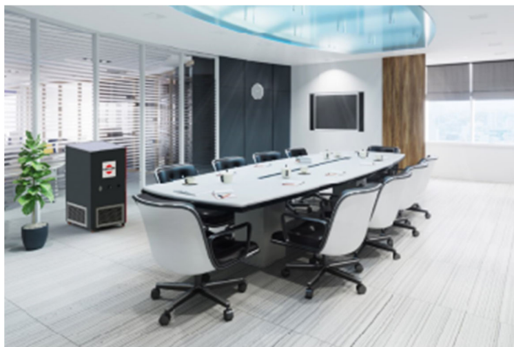
Bild 1: Mit Lösungen von Keller Lufttechnik können Betriebe jetzt nicht nur die Luft in Produktionshallen und Fertigungsstätten reinigen, sondern haben mit AmbiCube, AmbiWall und AmbiTower ebenfalls überzeugende Lösungen für Büros, Besprechungsräume, Kantinen sowie Hallen jeder Größe.

Bildmaterial zu dieser Presse-Information gibt es im „Infocenter“ unter www.keller-lufttechnik.de zum Download.