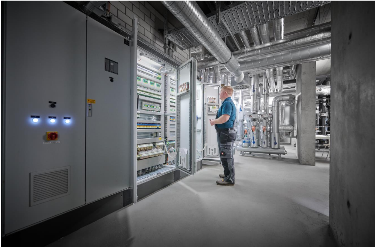
Bild: Innerhalb des GAZ gibt es fünf Gruppen von Verteilerschränken, in denen elektrische Geräte und Steuerungen installiert sind, darunter 95 Cylon-Controller, die für eine vollautomatische Steuerung der Heizung und Kühlung sorgen.