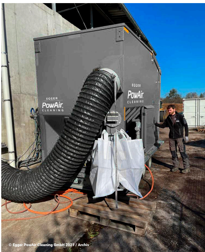
© Egger PowAir Cleaning GmbH 2021 / Archiv

Abgesaugt und entstaubt wird mit Saugbaggern mit 43.000 m 3 Saugleistung pro Stunde. Für die Betreiber von Industrieanlagen in ganz Europa hat sich dieser Reinigungsservice als ONE STOP SHOP von Egger PowAir Cleaning und PowAir Deutschland GmbH über die Jahre bestens bewährt.