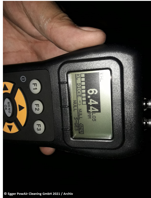
Bild 1 Wandstärkenmessung vorher