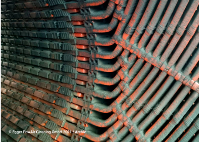
PowAir Cleaner von Egger Powair Cleaning GmbH im Einsatz