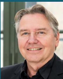
Wolf Schleth-Tams Campus EW GmbH Academy