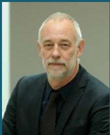
Dr.-Ing. Jobst Klien Campus EW GmbH Academy